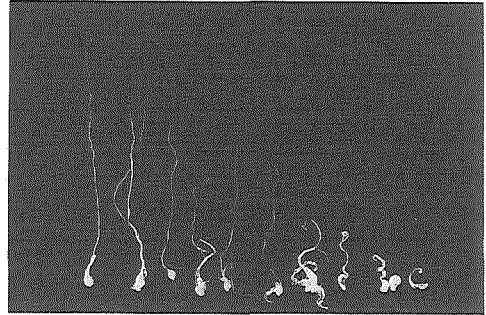
Fig. 2 Shoot formation from receptacle segments cultured on the MS medium containing 0.1 \text{ mg} \cdot \text{l}^{-1} NAA, at 105 days after planting.